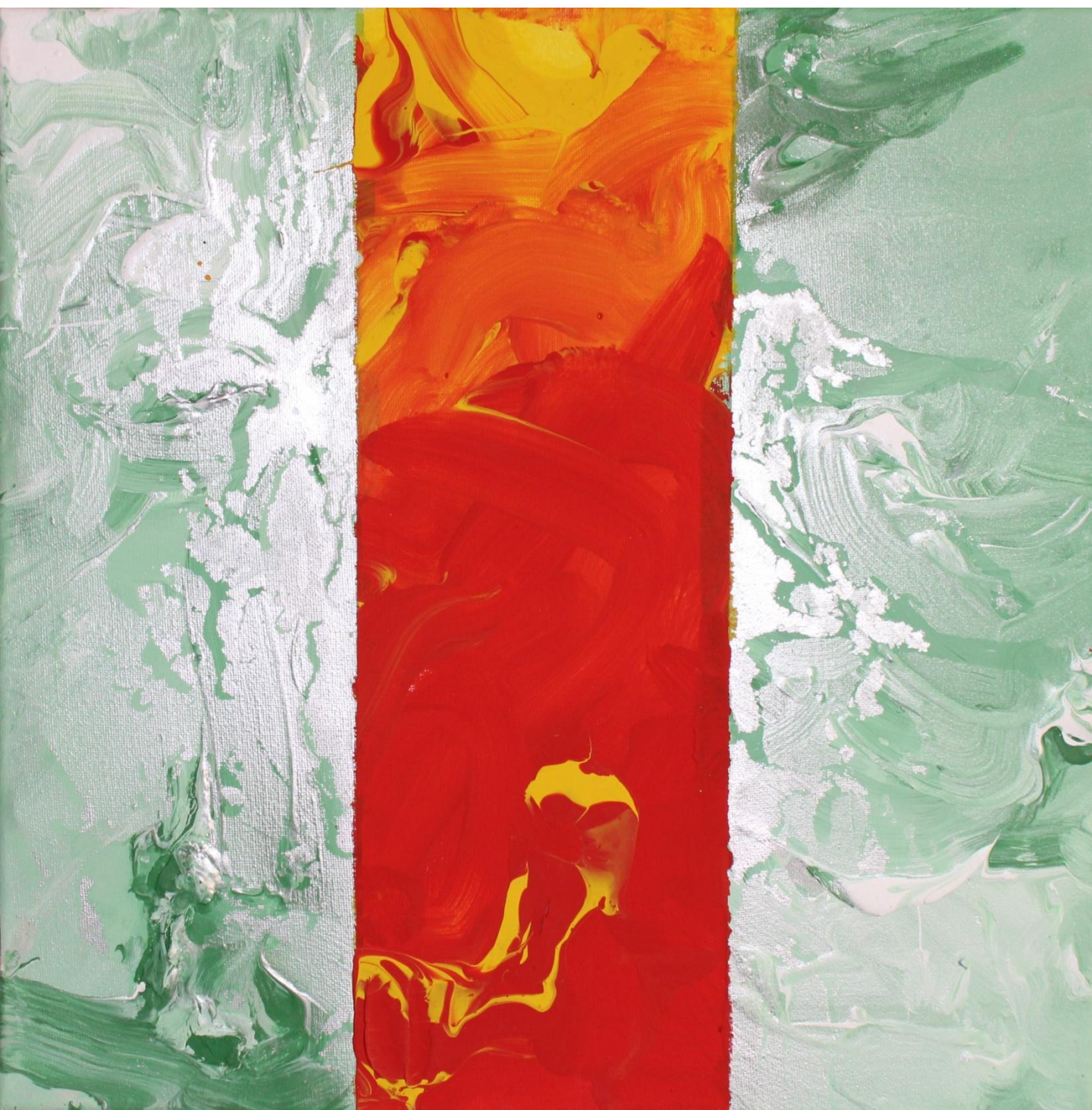
FERNANDO DELGADO Sem título, 2017 Acrílico s/tela 40x40cm 40€