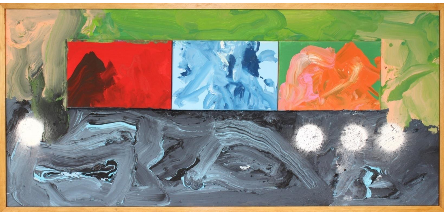
FERNANDO DELGADO Sem título, 2017 Acrílico s/tela 61x129cm 110€