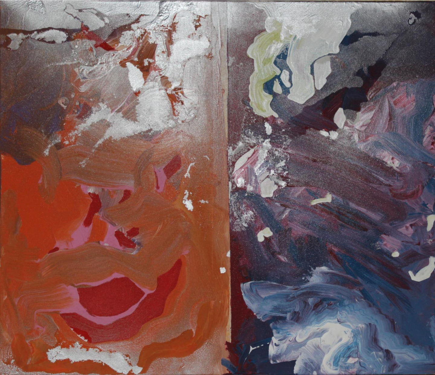
FERNANDO DELGADO Sem título, 2017 Acrílico s/tela 60x69,5cm 70€