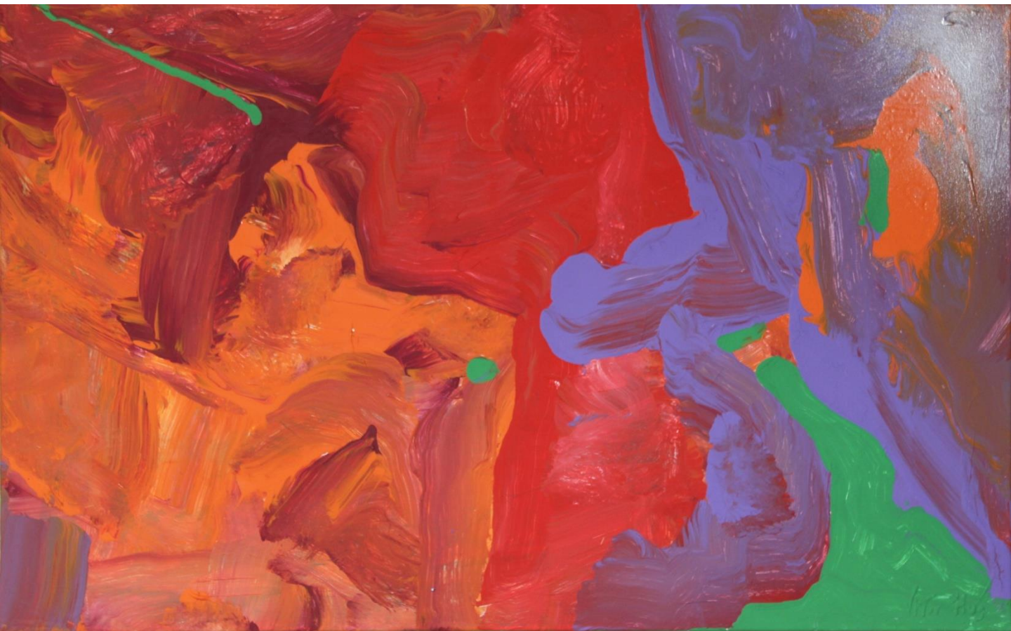
FERNANDO DELGADO Sem título, 2017 Acrílico s/tela 61x129cm 110€