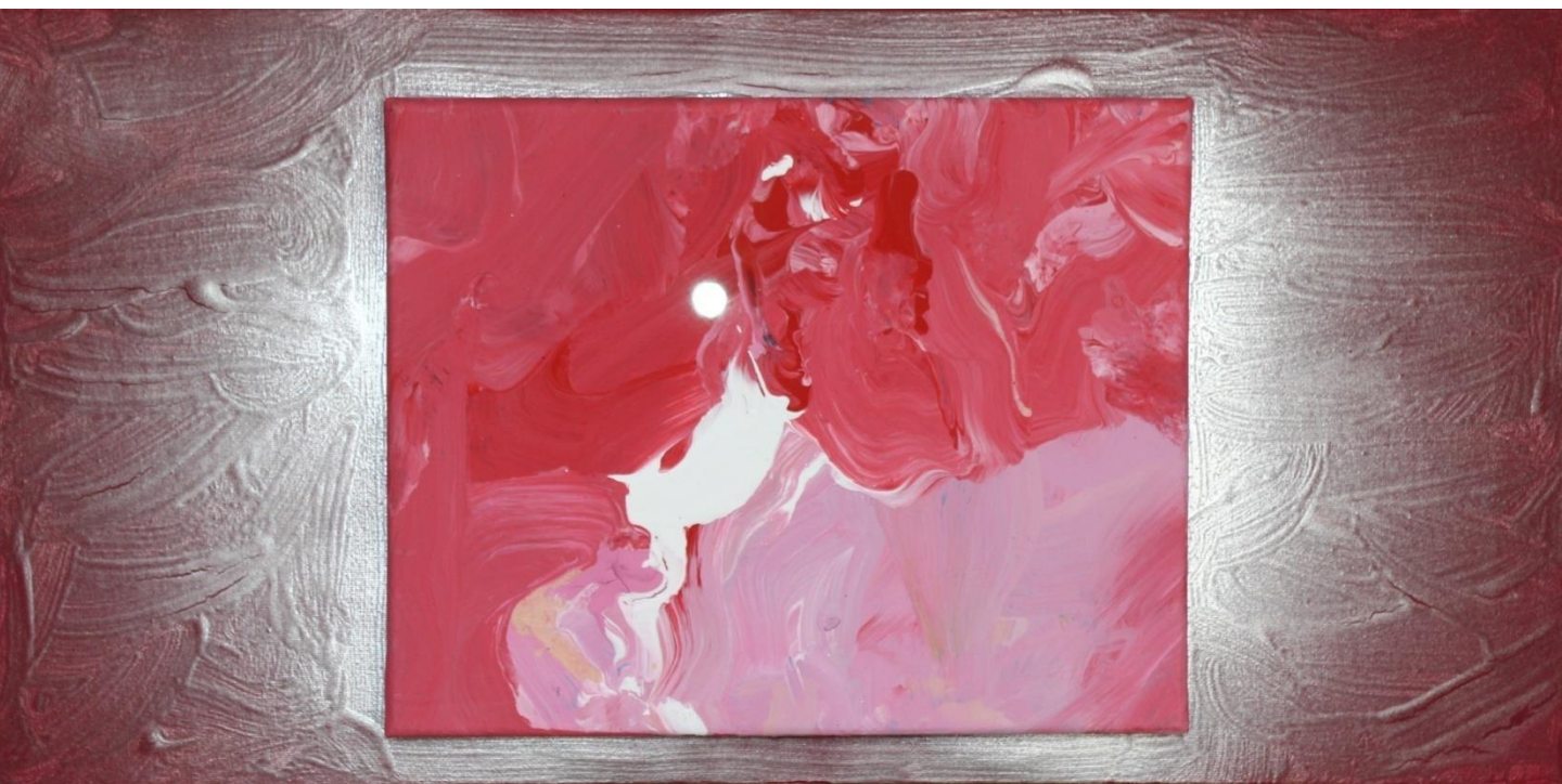
FERNANDO DELGADO Sem título, 2017 Acrílico s/tela 29,5x60cm 40€