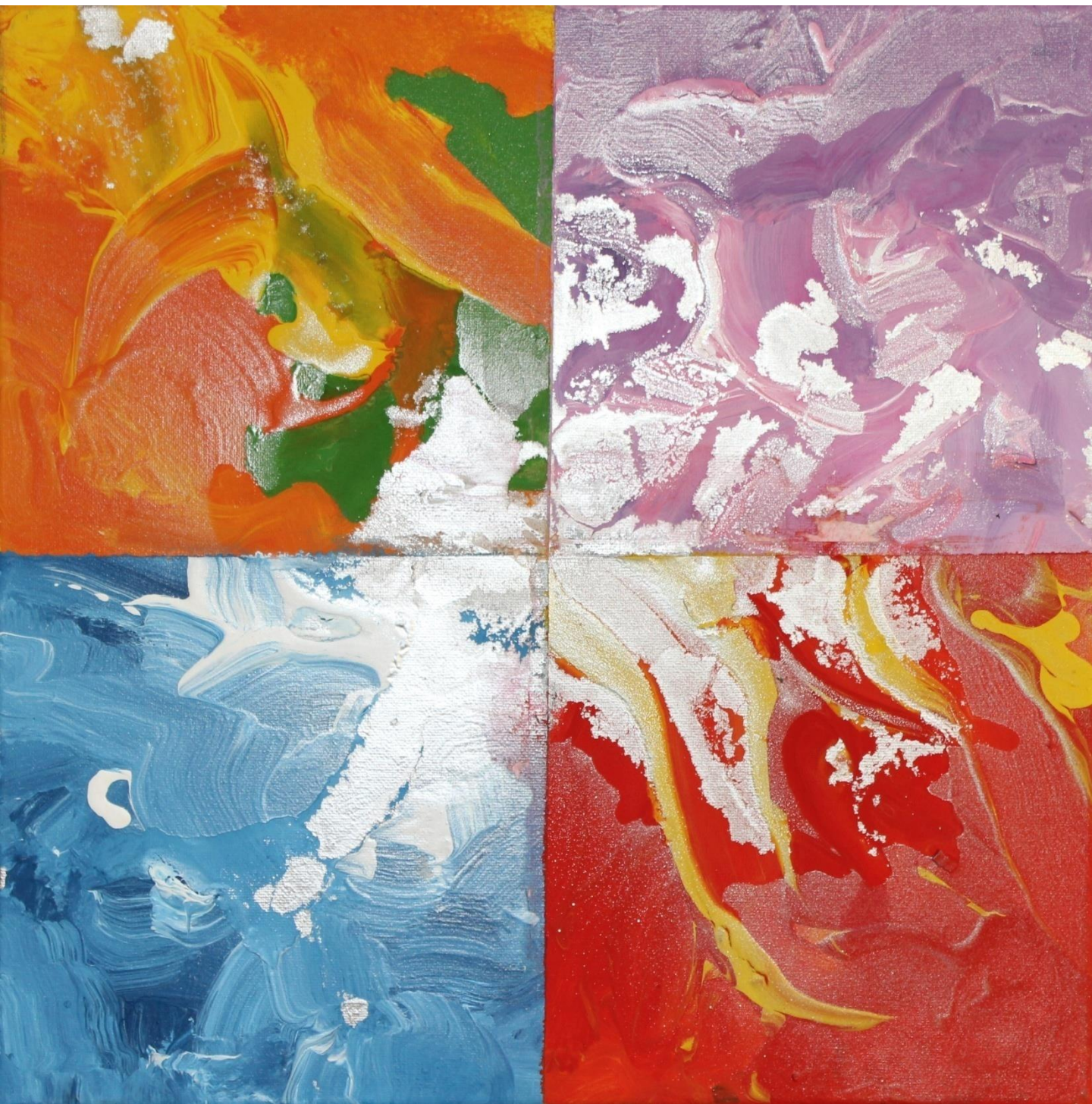
FERNANDO DELGADO Sem título, 2017 Acrílico s/tela 40x40cm 40€