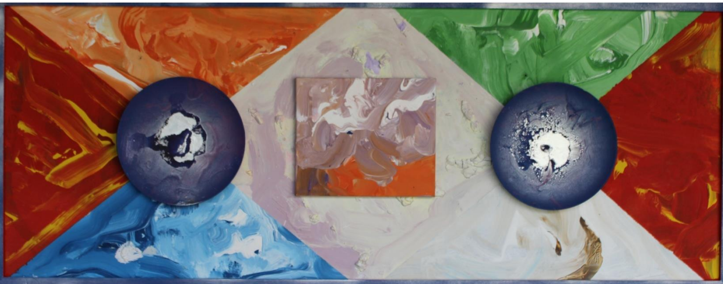
FERNANDO DELGADO Sem título, 2017 Acrílico s/tela 62x159cm 120€